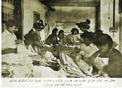
حلال احمر خانلر حاران عومومستغده مجروح غازيلرله معاوت ايون ايراز اولغان قدايت السانيه و شفتككارانه من برستلر .

Ek-2: “ Hilâl-i Ahmer Hanımlar Merkez-i Umûmisi'nde yaralı gazilerimize yardım için ibraz olunan faaliyet-i insaniye ve şefkatkârânenen bir manzara”, Servet-i Fünûn , 10 Haziran 1915